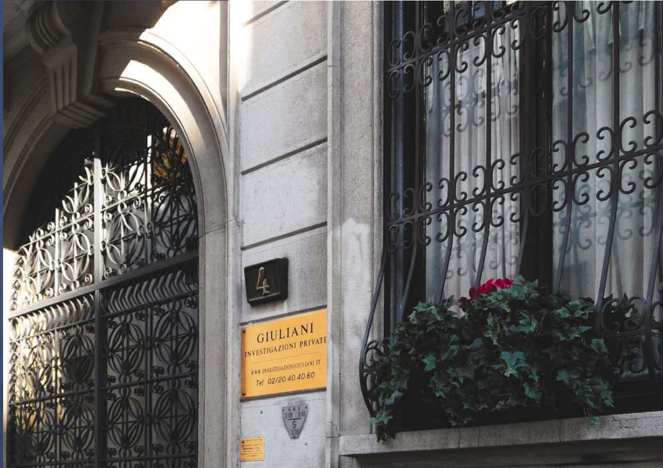
VIA GIORGIO JAN 4, MILANO